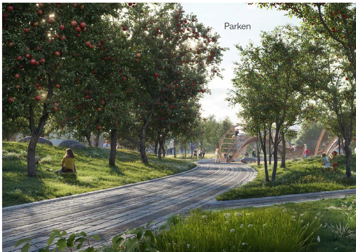
Illustrasjon av Gran Park