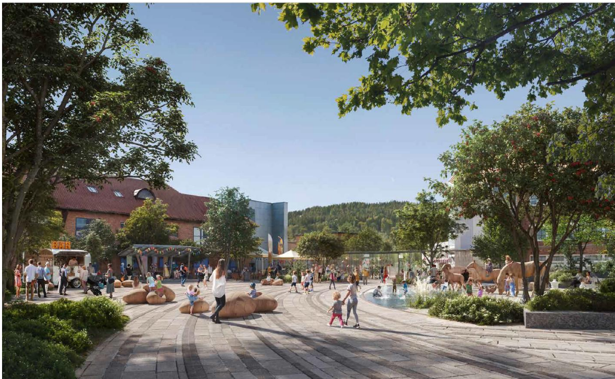
Illustrasjon av Gran Torg. III. Snøhetta.