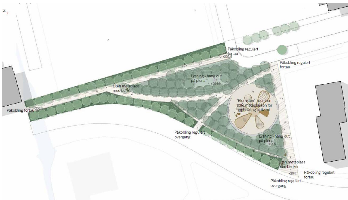
Plantegning av Gran Park, plassering av kunst er valgfritt