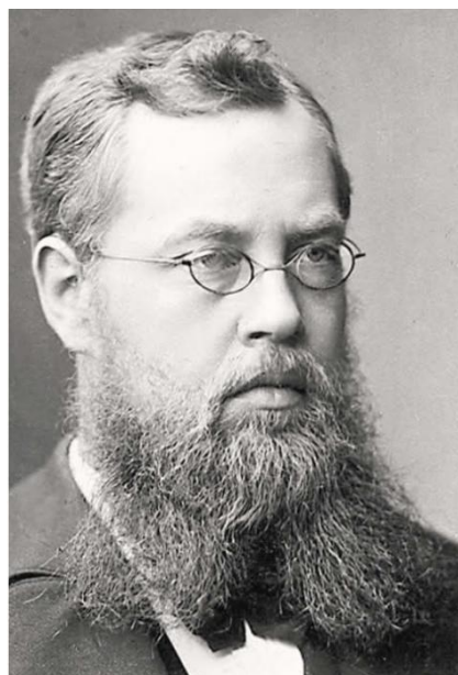
Sophus Lie Av KF-arkiv.