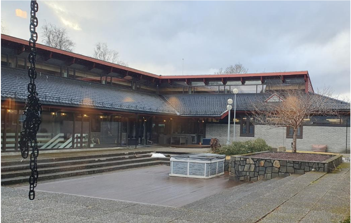
Figur 5 atriumet

Ønsker å få en synfaring, send melding til saskia.burleson@fjordane.fhs.no