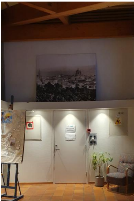
Figur 4 vegg på ende av korridoren