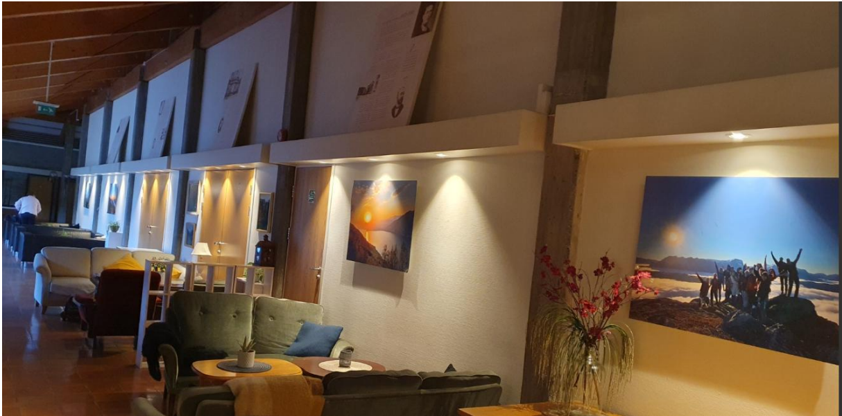
Figur 1 korridor ved hoved inngangen som ser ut på atriumet