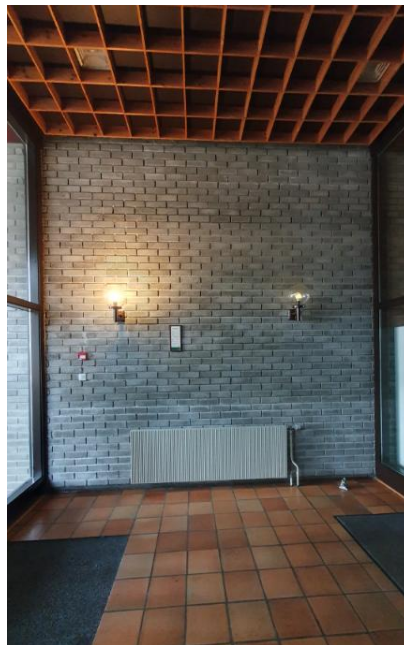
Figur 2 inngangspartiet