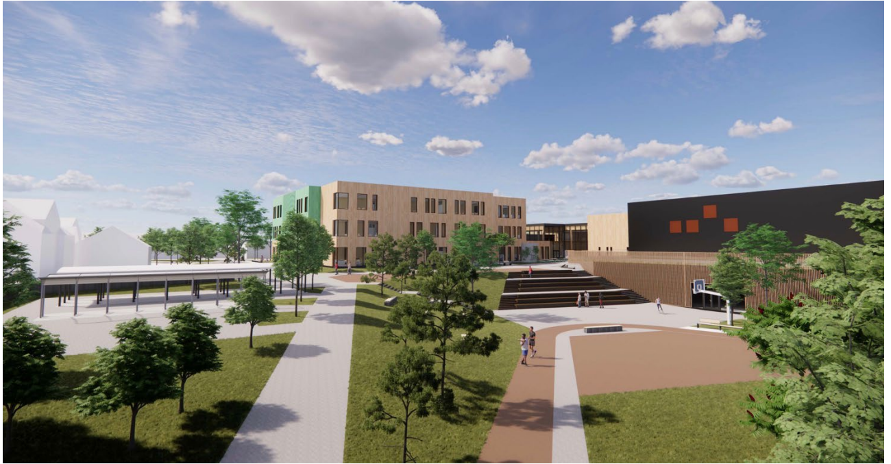
Illustrasjon 6. Skolegård/fritidspark sett fra sørøst.