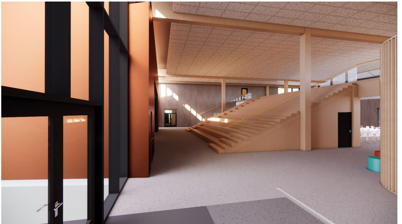
Illustrasjon 3. Interiør «Hjerterom».