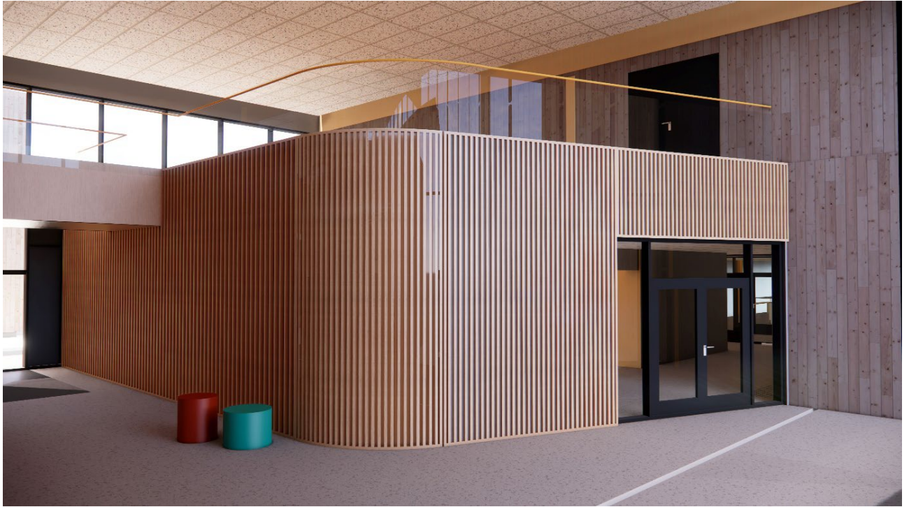
Illustrasjon 4. Buett vegg interiør hjerterom