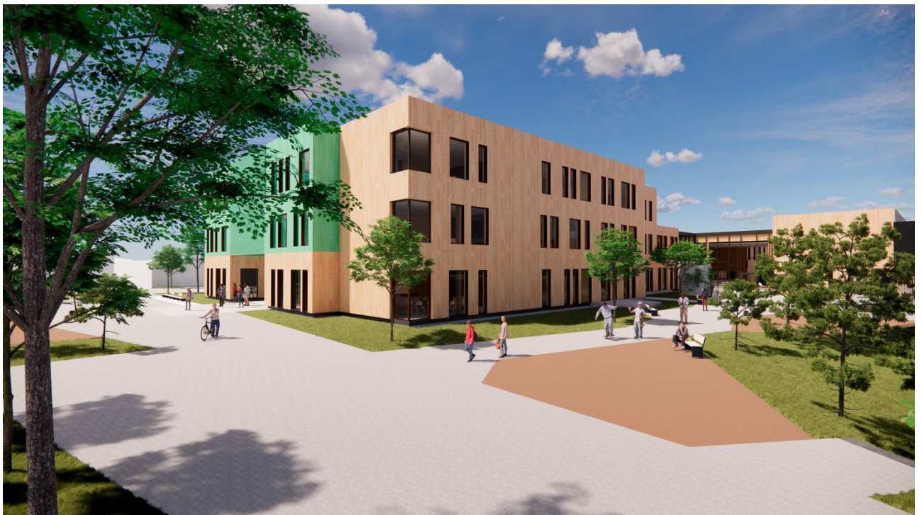
Illustrasjon 7. hovedadkomst for elever ved nye Haraldsvangskole sett fra øst.