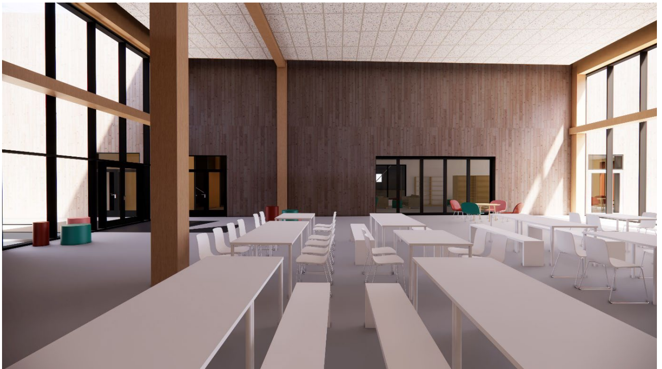
Illustrasjon 5. Kantine, stor vegg i tre.