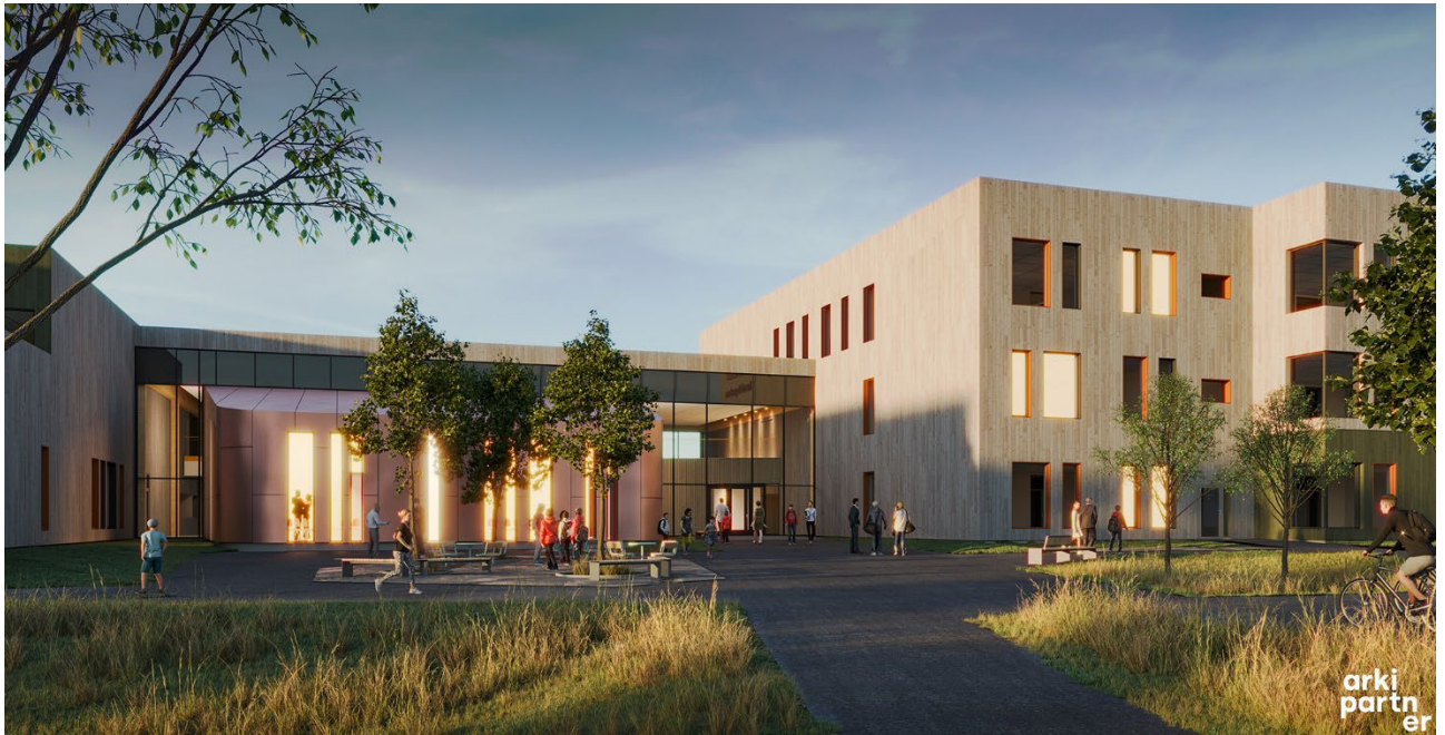
Illustrasjon 1. Torg og hovedankomst til den nye Haraldsvang skole og flerbrukshall.